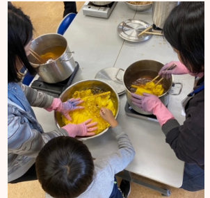
むきばんだ史跡公園スタッフがサポートします。